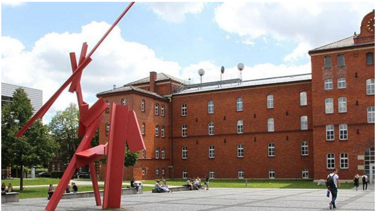
Abbildung 1 - Der Campus Ansbach

An der Hochschule Ansbach finden Sie in Gebäude 70 die Bibliothek, die Sie für Ihr Studium nutzen können. Hier erhalten Sie Zugang zu regulärer Buchausleihe inkl. aller digitalen Recherchemöglichkeiten. Weiterhin finden Sie am Campus in Rothenburg eine Bibliothek mit einem Bestand von ca. 1.000 Medien (Bücher, Zeitschriften-Abos). Der Bestand orientiert sich an den Modulen der Studiengänge Digital Marketing und Interkulturelles Management.