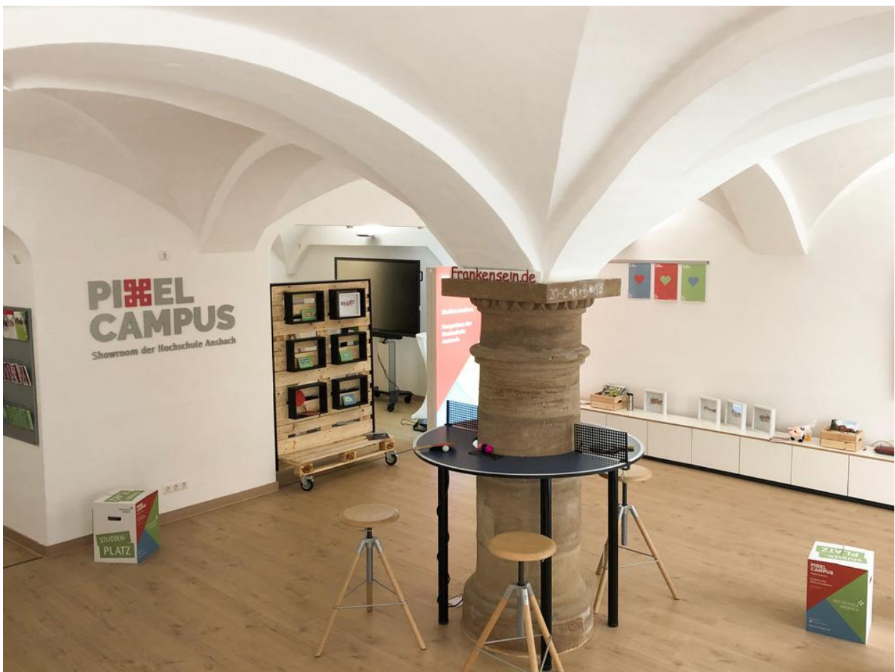
Abbildung 3 - Pixel Campus in Ansbach