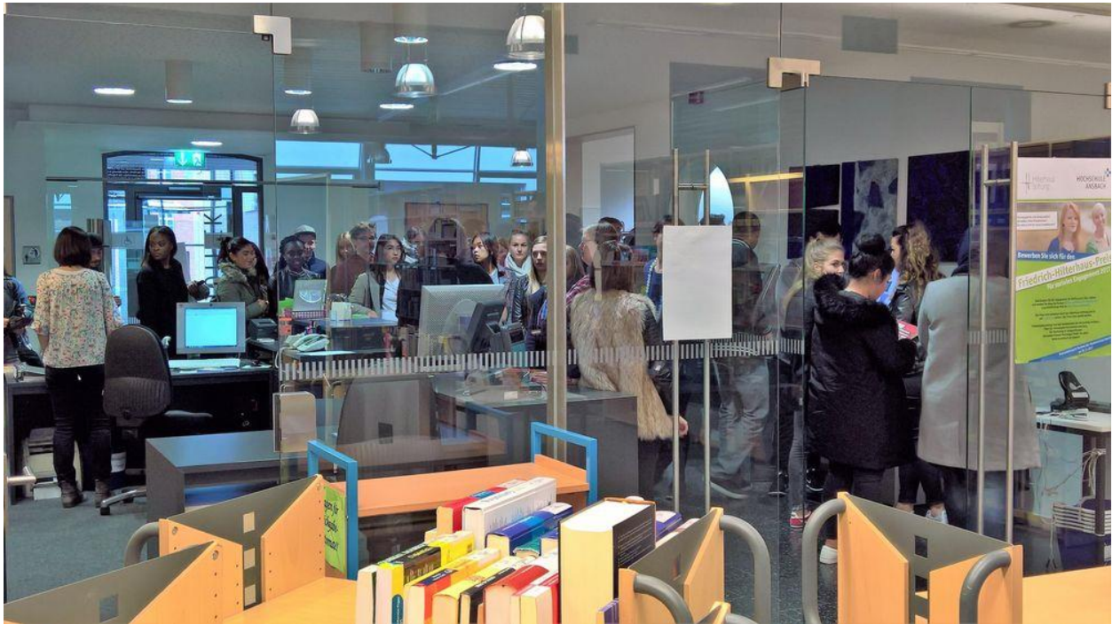
Abbildung 2 – Bibliothek am Campus Ansbach