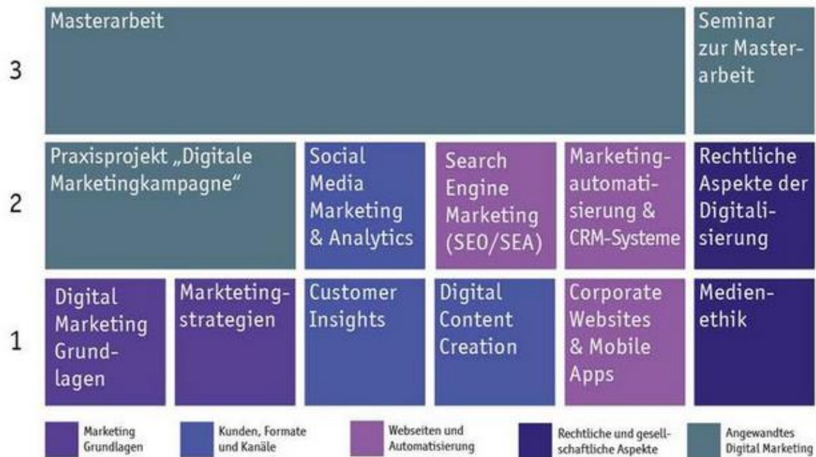
Abbildung 5 - Modulplan Digital Marketing

Der folgende Überblick zeigt, wie die Module im Studiengang Digital Marketing auf Basis der aktuellen Studien- und Prüfungsordnung aufeinander aufbauen.